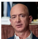
Jeff Bezos Amazon.com Founder And CEO

As you might imagine, I often get asked by young entrepreneurs how to start a business. What many seem to want is some magic set of tools that will allow them to launch a business from scratch. Well, there's no magic involved, but the key is quite simple: Value your customers, hire well, find a market, and realize that someday I will utterly crush you.